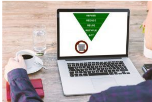
ZW in Gewerbe, Institutionen & andere Organisationen