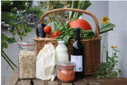
Zero Waste Lebensstil

Wir richten uns an individuelle Menschen und Haushalte mit dem ZW Lifestyle aber auch an Unternehmen, Institutionen und Organisationen sowie Städte