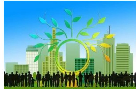
Zero Waste Cities